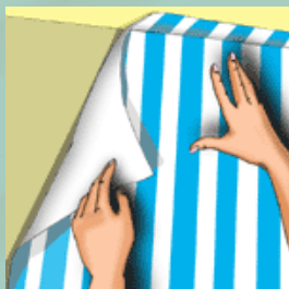
Planche con la espátula ancha el paño, cuidando de hacerlo del centro hacia los extremos y evitando que se formen burbujas de aire.

Coloque un extremo del paño sobre el borde del cielorraso, dejando una pestaña de algunos centímetros y déjelo colgar.